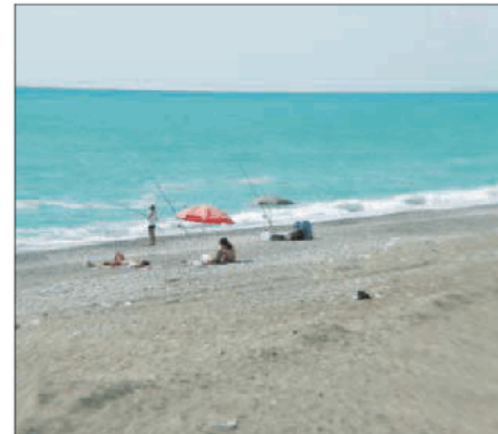
La spiaggia paolana