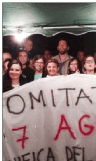
Attivisti in prima linea

«Fogna e inquinamento nel canale che ricordiamo deve essere solo a servizio delle acque bianche. È incredibile quanto sta succedendo. Non ci stiamo a far passare questo nuovo scempio sotto silenzio? Si-